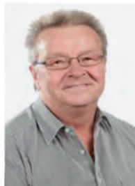
Franz Floth Fraktionsvorsitzender