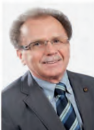
Werner Walberer 1. Bürgermeister